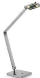
61.620.xx Tischleuchte / table lamp 7 W LED, 3.000 K, 1.190 lm Energieeffizienzklasse D energy efficiency class D