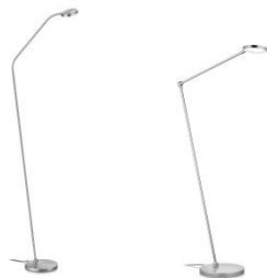
THEA-S-Flex und THEA-S 41.975.xx und 41.980.xx Stehleuchte / floor lamp 10,8 W LED, 2.700 K, 1100 lm