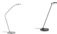
THEA-T-Flex und THEA-T 61.623.xx und 61.626.xx Tischleuchte / table lamp 10,8 W LED, 2.700 K, 1100 lm