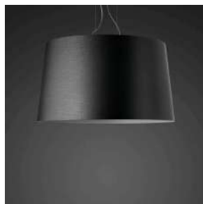
Twice as Twiggy