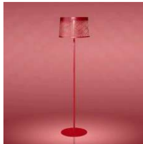
Twiggy Grid Lettura