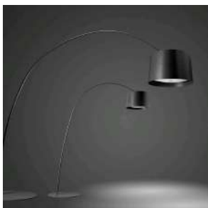
Twice as Twiggy