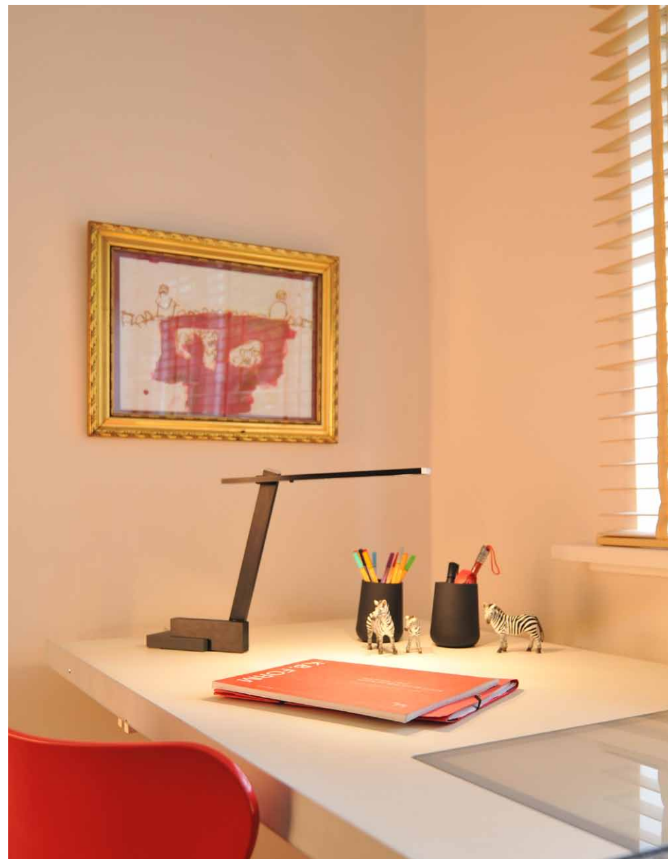
NASTRINO PICO mit Tischfuß, geschliffen schwarz with table base, brushed black NIP-105