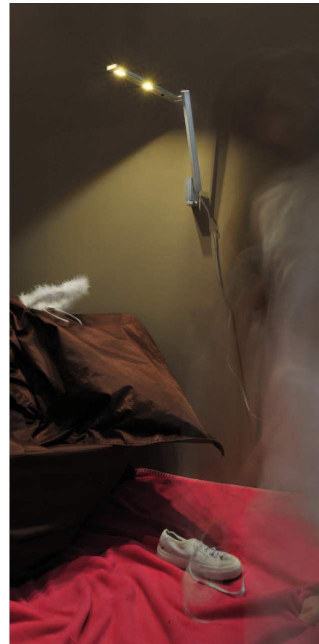
NASTRINO PICO Wandhalterung Wall fastening NIP-400