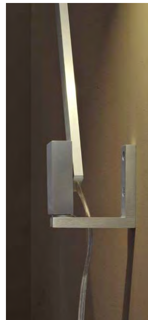
Wandhalterung Wall fastening

An unusual idea gave rise to the Nastro series. Two 9 mm profiles meet and end in a base element where they are held invisibly. The upper arm has two LED zones controlled by the adjoining switch. A spring-mounted joint links the upper arm with a transverse profile. Change of direction. The whole structure is invisibly screwed to the base. The cable penetrates the table base. That's all.