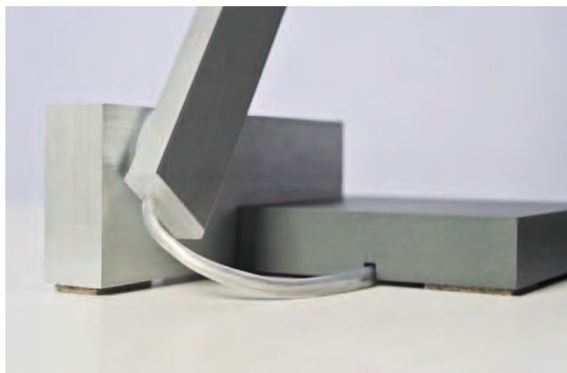
Kabelführung durch Tischfuß Cable guide through table base