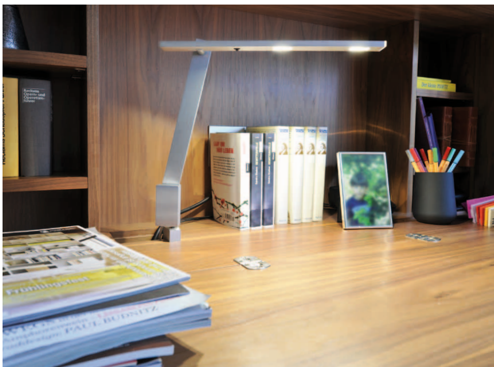
NASTRINO PICO mit Tischklemme, geschliffen matt with table clamp, brushed matt NIP-200