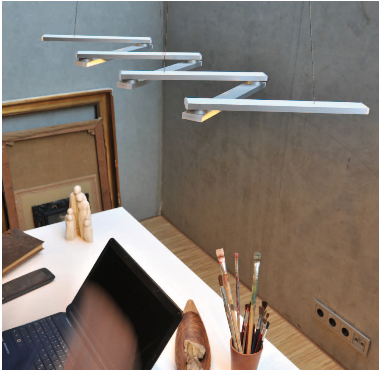
NASTRO Aluminium geschliffen, matt eloxiert brushed aluminium, matt anodised