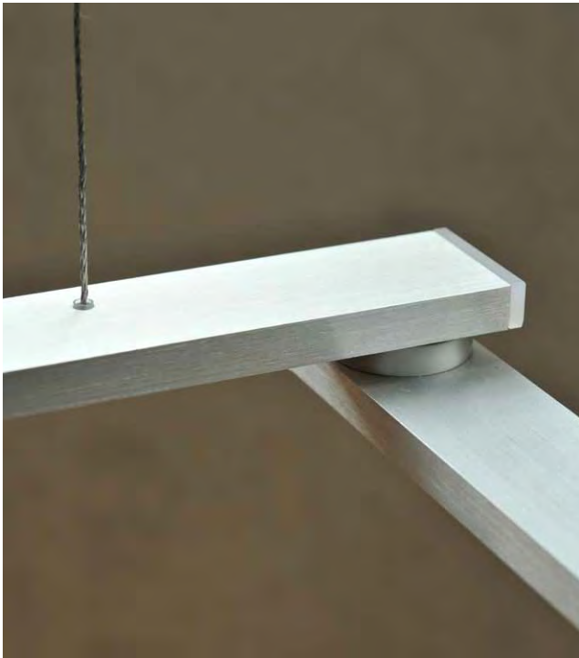
Pendelpunkt und Drehgelenk Pendant fixture and swivel joint