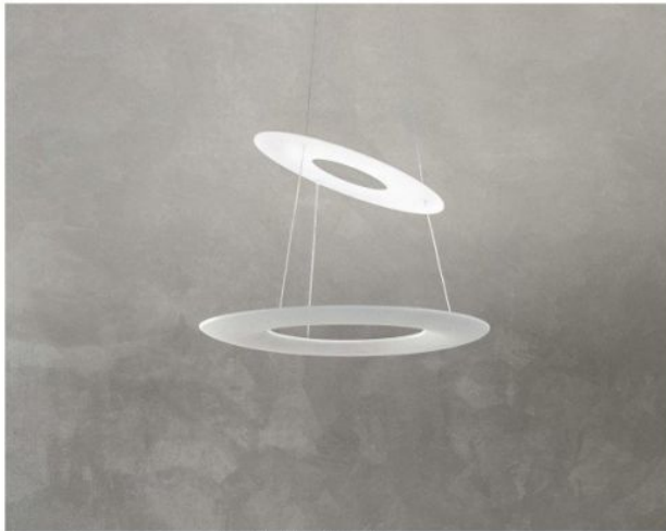
Available Versions Erhältliche Ausführungen