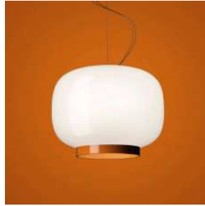
Chouchin Reverse 1