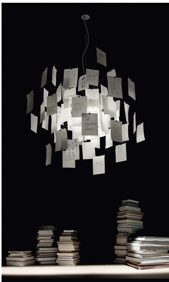
Zettel'z 5 INGO MAURER 1997

Edelstahl, hitzebeständiges satiniertes Glas, Japanpapier. 31 bedruckte und 49 unbedruckte Blätter DIN A5. Die Zettel'z 5 ist eine der bekanntesten Lampen von Ingo Maurer. Sie lässt dem Anwender sehr viel Spielraum für eigene Kreativität. Sie kann raumgreifend, locker oder schmal und dicht gesteckt werden. Die mitgelieferten Blanko-Zettel sollen für eigene Messages oder Skizzen genutzt werden. Das japanische Papier ist sehr dünn und transluzent. Zwei Leuchtmittel sorgen für gutes Licht.