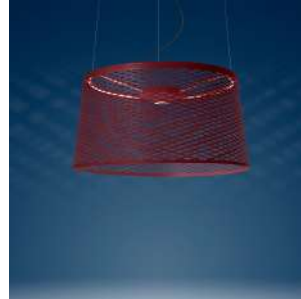
Twice as Twiggy Grid