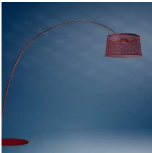
Twice as Twiggy Grid