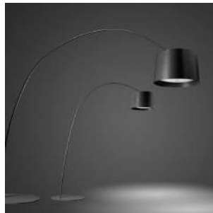
Twice as Twiggy