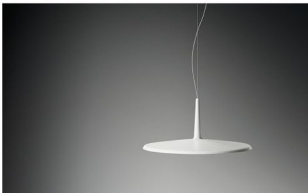
Available Versions Erhältliche Ausführungen